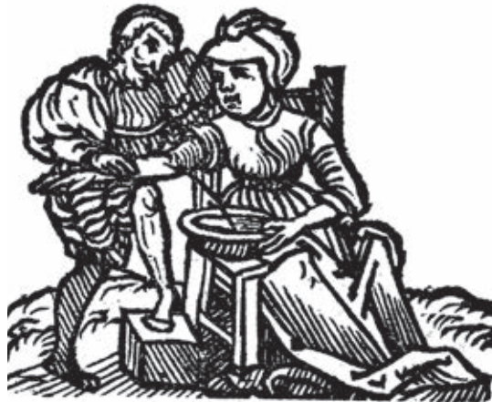
Bild 3. Åderlättningsbilden är från 1544 och visar en kvinna som åderläts på armen. Den ger vid handen att metoden utfördes på samma sätt som man ser den avbildad vid tiden för åderlätningens upphörande i början av 1900-talet hos oss. Enligt Ryff 1544, Nationalbiblioteket.

De svenska läkeböckerna talar om att ådrorna i de båda öronhålorna på vardera sidan hjälper mot öronvärk, susande öron, flytande ögon och dövhet, liksom att de två ådrorna på båda sidorna om halsen näst intill öronen hjälper mot hjärtvärk, för minskandet av drömmar samt mot ögonsot och dövhet (10).